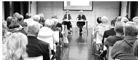
družnicu SUH-a Labin, koja je organizirala ovu radionicu na jako visokoj razini.

Sudionici su iskazali veliki interes i za inkluzivni dodatak te ih je zanimalo postoje li i tu limiti i koliko se čeka na rješenje. I ova radionica polučila je veliki uspjeh, jer su je sudionici u evaluacijskim listićima ocijenili s odličnom ocjenom. Poslije radionice organizirano je neformalno druženje uz domjenak. Svakako treba pohvaliti i Po-