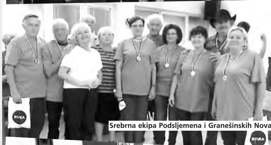
Srebrna ekipa Podsljemena i Granešinskih Novaka