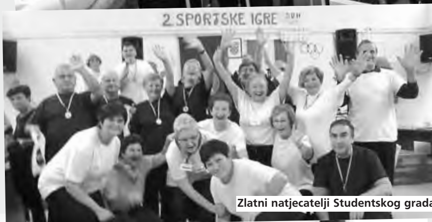
Zlatni natjecatelji Studentskog grada