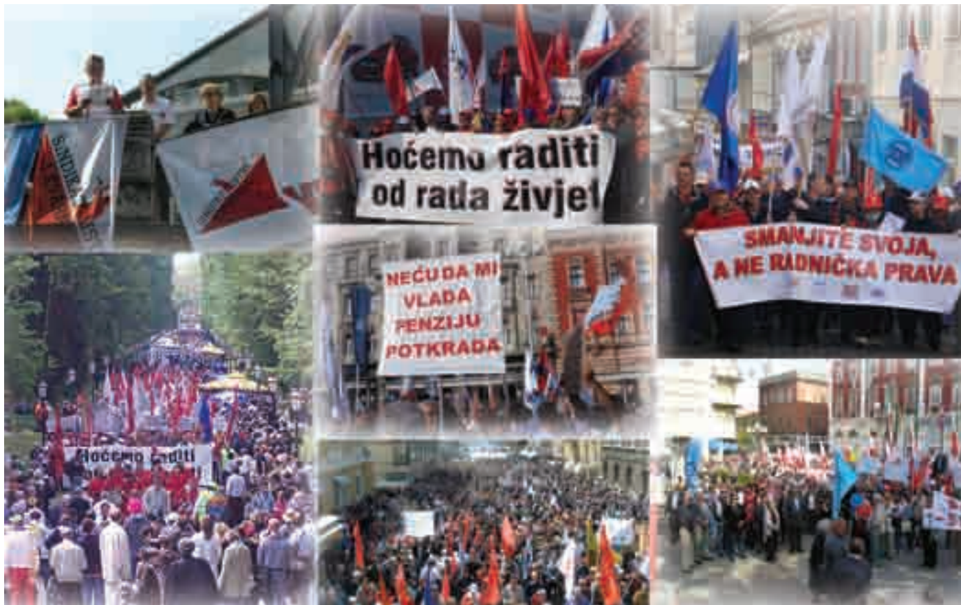
Članice i članovi Sindikata umirovljenika Hrvatske na prosvjedima zajedno s aktivnim radnicama i radnicima zahtijevaju i brane radnička prava utemeljena na radu i zajamčena Ustavom socijalne države